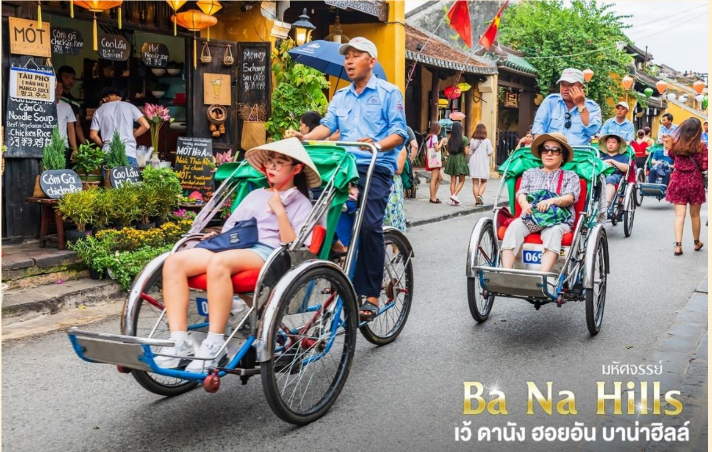
มหัศจรรย์ Ba Na Hills เว้ คานัง ฮอยอัน บาน่าฮิลล์

(ไม่รวมค่าทิปคนขี่สามล้อ ท่านละ 40 บาท/ต่อท่าน/ต่อทริป)